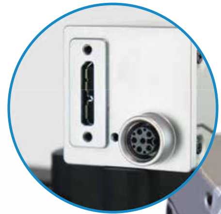
USB 3.0-Anschlüsse mit professionellen Kabeln

ScanXpert FX ist bis ins kleinste Detail durchdacht und bietet hochwertige 3D-Scans. Das Design wurde von Grund auf neu optimiert. Dies ermöglicht mehr Konsistenz und Stabilität und gewährleistet einen reibungslosen und intuitiven 3D-Scan-Workflow. Mit dem ScanXpert FX erreichen Sie in vielen Einsatzszenarien hervorragende Ergebnisse.